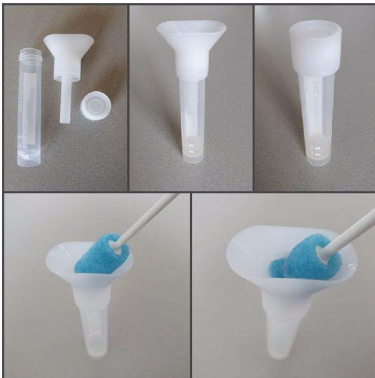
Figuur 1. Isohelix speeksel verzamelbuis met opschroeftrichter met terugloopbeveiliging en manier van gebruik met Oracol S10 speekselspons. Na speeksel verzamelen met de spons wordt deze uitgedrukt in de trechter en herhaald tot 1-2 ml speeksel is verzameld.